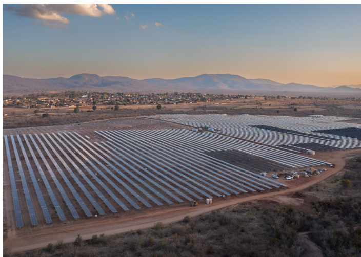
Bolobedu, Afrique du Sud | 148 MW

SPRING repose d'abord sur un recentrage stratégique clair autour des activités de Développement et de Vente d'énergie, ainsi que sur les géographies et technologies les plus créatrices de valeur. Voltalia a ainsi décidé de céder ou d'arrêter les activités de développement dans cinq pays et de concentrer ses investissements sur le solaire, l'éolien terrestre et le stockage par batteries. Les cessions d'actifs non stratégiques prévues entre 2026 et 2028 devraient générer 300 à 350 millions d'euros, soutenant le retour à un résultat net positif dès 2026 et une trajectoire progressive de désendettement.